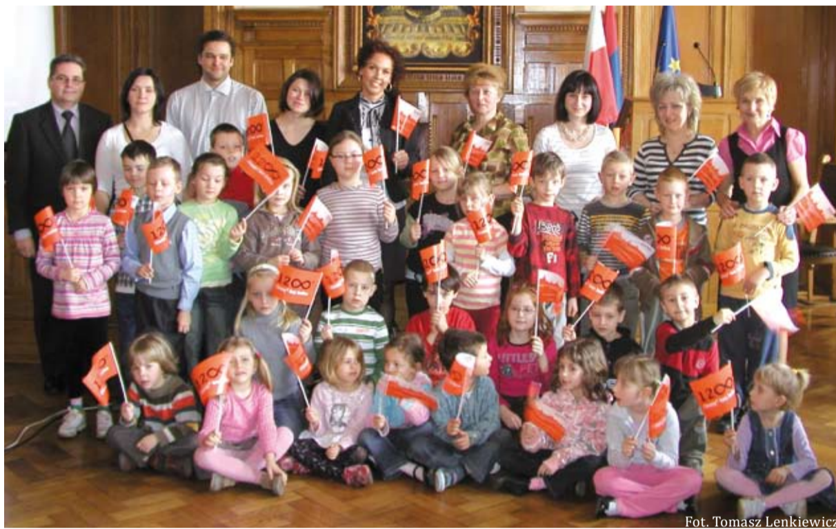
Uczestnicy spotkania w Sali Sesyjnej Ratusza

Wszyscy reprezentanci przedszkoli otrzymali upominki.