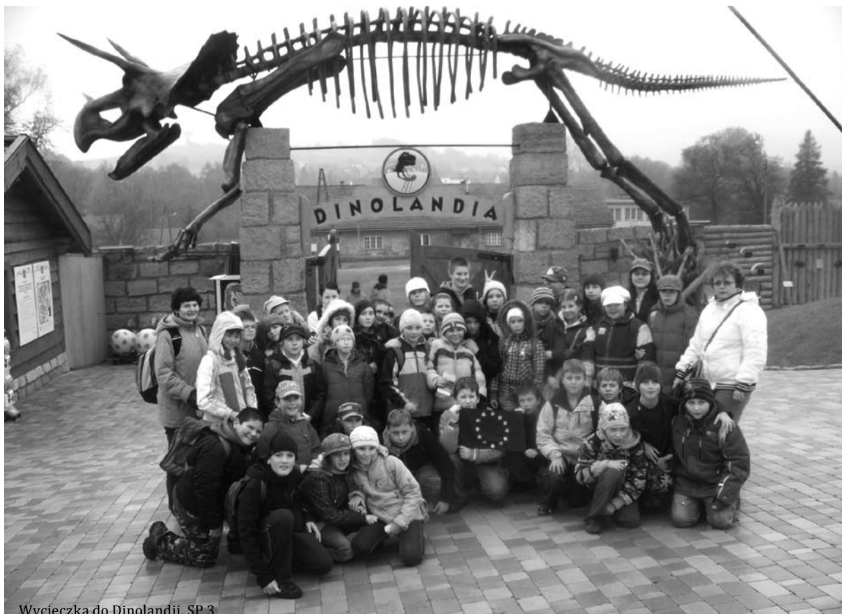
Wycieczka do Dinolandii, SP 3