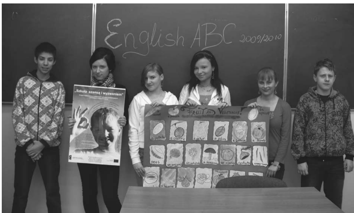
Kółko językowe z G2