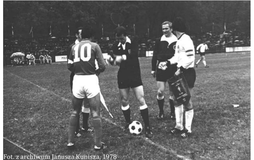
Fot. z archiwum Janusza Kunisza, 1978

Warto przypomnieć, że w 1978 r. Cieszyn był gospodarzem meczu Portugalia - RFN w ramach turnieju juniorów UEFA /obecnie mistrzostwa Europy do 18 lat.