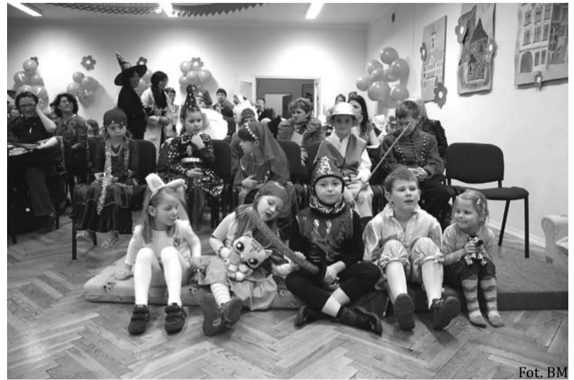
Uroczyste otwarcie „Nocy”

Noc z Andersenem - niecodzienna impreza, która sprawia tak wiel-