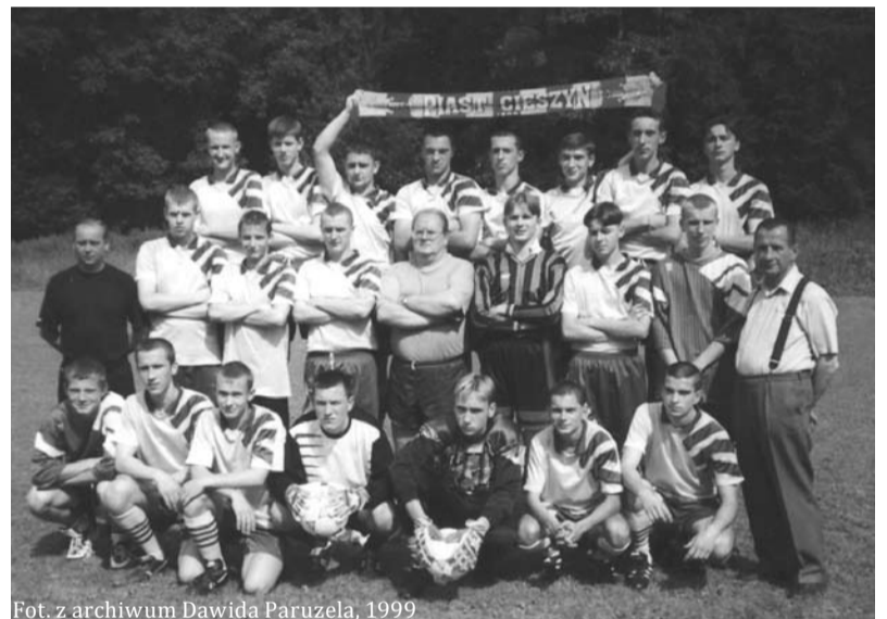
Fot. z archiwum Dawida Paruzela, 1999

Również cieszyńska młodzież piłkarska od zawsze należała do czołówki Beskidzkiego OZPN. W latach 1985/86 i 1998/99 juniorzy starsi awansowali do ligi międzywojewódzkiej.