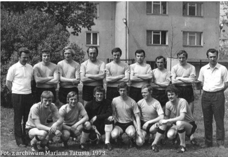
Fot. z archiwum Mariana Tatusia, 1973

Na zdjęciu drużyna piłkarska KS Cieszyn - mistrz klasy A powiatu Bielsko - Cieszyn, w sezonie 1972/73.