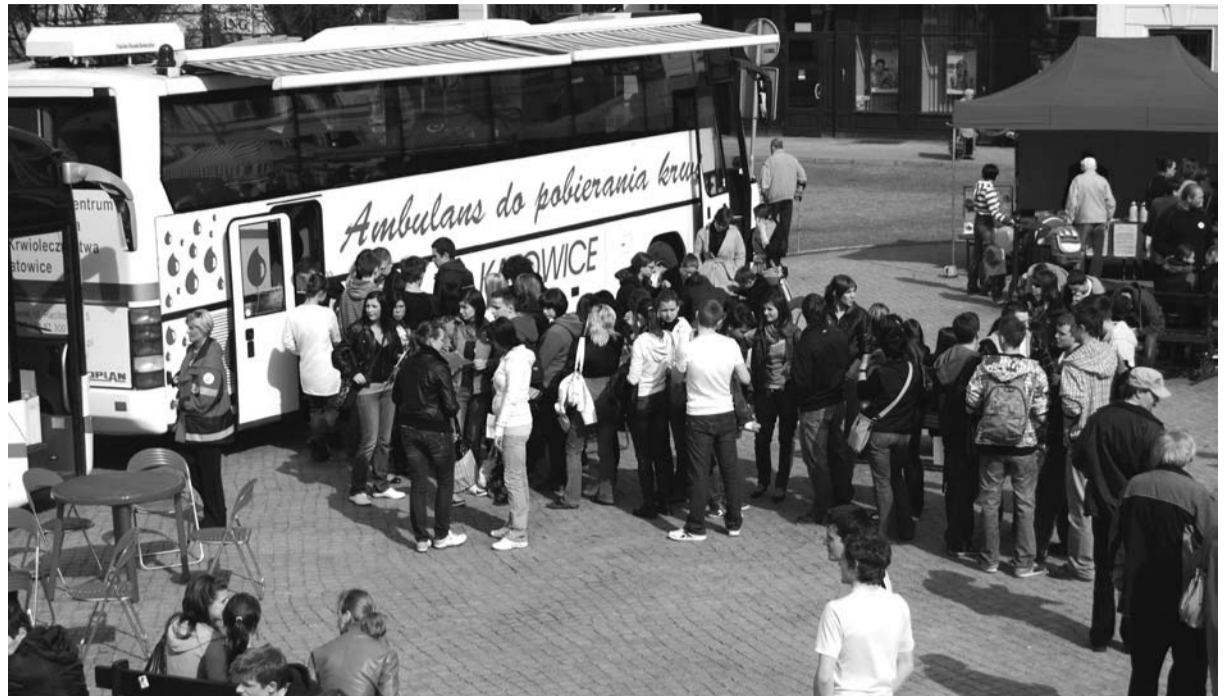
Młodzież szkolna ustawiała się w kolejkach, aby oddać cząstkę siebie

Akcję wsparło wiele firm z powiatu cieszyńskiego. Podziękowania należą się Agencji Reklamowej „Paté”, drukarni „OFFSETdruk i MEDIA”, firmom „Andarex” i „Pol-