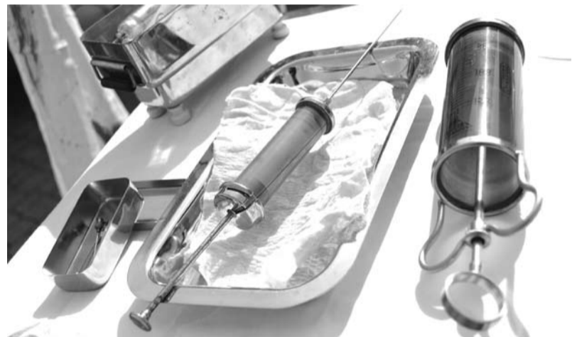
W trakcie akcji można było zobaczyć m.in. wykorzystywany kiedyś sprzęt medyczny

sat Cyfrowy”, kwiaciarni „Mariusz”, piekarni „Wiślanka”, firmie „RENAULT” Mador-Gadocha Sp. z o.o. z Cieszyna, hotelowi „Gołębiowski” z Wisły, Wydawnictwu „Pascal” z Bielska-Białej, pływalni „Delfin” ze Skoczowa, firmie „Eldom”, firmie „fotoSprinter”, siłowni „Pro Aktiv Fitness Center” z Czeskiego Cieszyna, jubilerom „Domino” i „Kleopatra”, drogerii „Natura” z Cieszyna, Bankowi Zachodniemu WBK, Firmie „Moda męska - Giacomo Conti”, Firmie papierniczej „A-Z”, Wiślańskiemu Centrum Kultury wypożyczalni limuzyny „Kecaj” oraz cieszyńskim restauracjom, kawiarniom i pizzeriom „Pod Zieloną Trójką”, „Palermo”, „Jedynka”, Karczma „Pod Dębem”, „Straszny Dwór”, „Liburnia”, „Bati”, „Maska”, „Czampiński”, „Milorbar”, „Mokka Cafe”, „City Pizza”, „La Nostra”, „Orbis”, „Cafe Muzeum”,