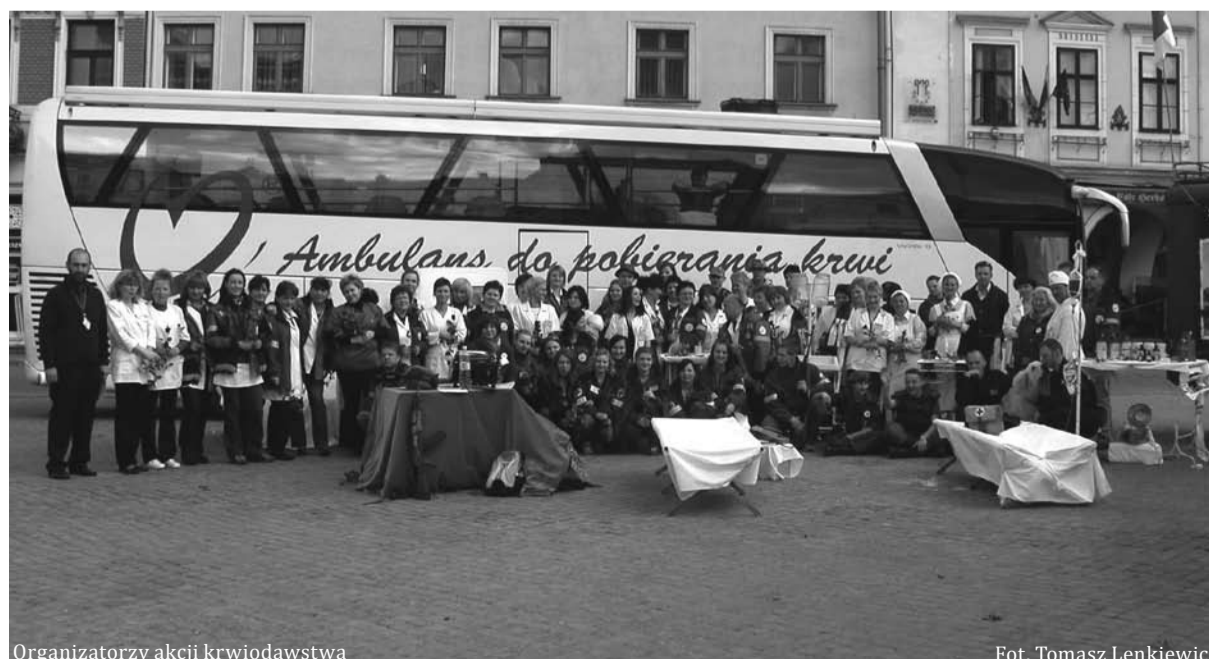
Organizatorzy akcji krwiodawstwa