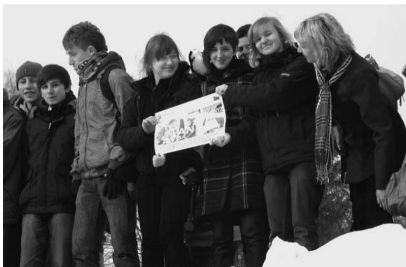
Wycieczka na Równicę, G1

Na zajęciach pozalekcyjnych z przyrody uczniowie poznali rezerwat przyrody na terenie Cieszyńska, uczyli się rozpoznawać rośliny, zdobyli wiadomości na temat budowy geologicznej, brali udział w wystawie fotograficznej „Przyroda w obiektywie”, przeprowadzili zbiorówkę karmy dla schroniska zwierząt i brali udział w wycieczce do Wisły Gościejowa.