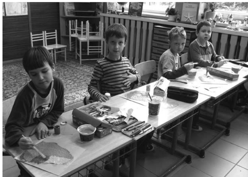
Zajęcia artystyczne w SP 7

Koło teatralne przygotowało program z okazji uroczystego otwarcia szkolnego basenu i sali gimnastycznej, Dnia Edukacji Narodowej, zorganizowano również lalkowe warsztaty teatralne i udział w spektaklu Teatru Banialuka.