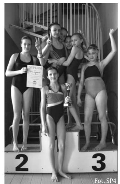
Złote pływaczki z SP4