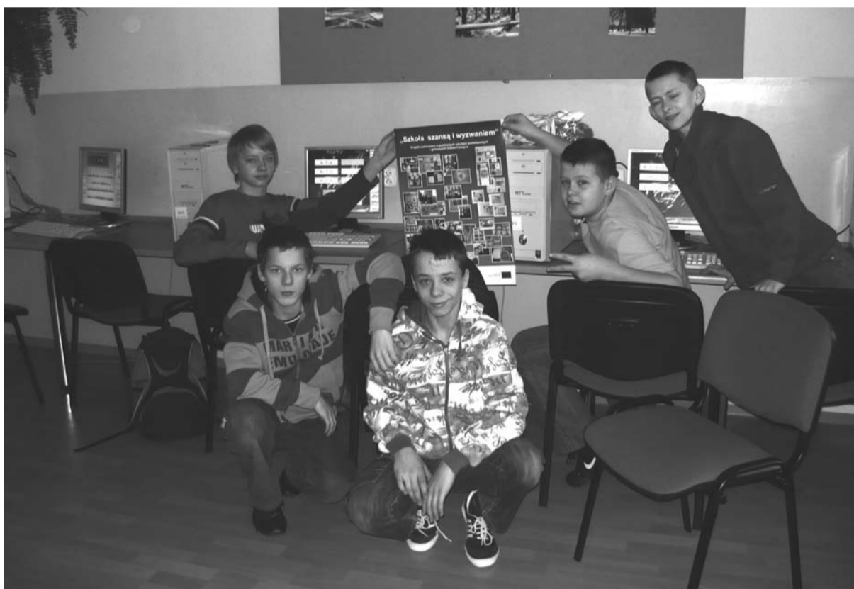
Zajęcia matematyczne w SP6