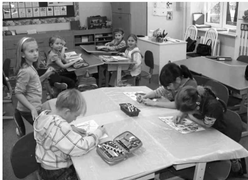
Kółko plastyczne SP 2

Na zajęcia dydaktyczno – wyrównawcze w zakresie języka obcego uczęszcza 210 uczniów.