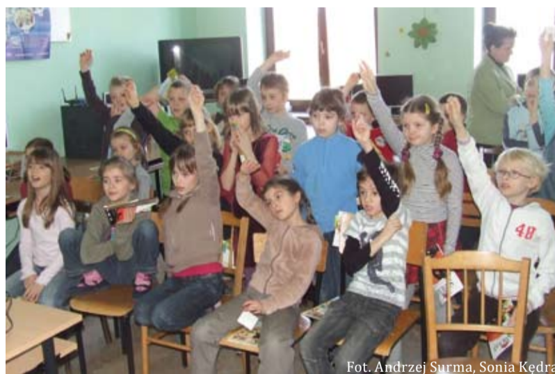
Dzieci brały aktywny udział w zajęciach

W miarę wzrostu popularności nowych technologii młodzi ludzie coraz swobodniej poruszają się w sieci. Przenoszą do niej swoje pry-