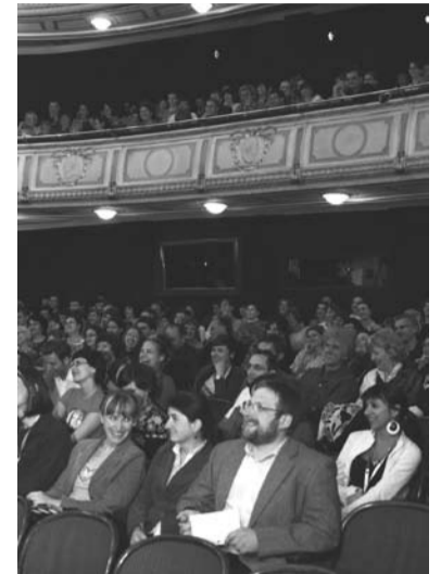
Festiwalowa publiczność w teatrze