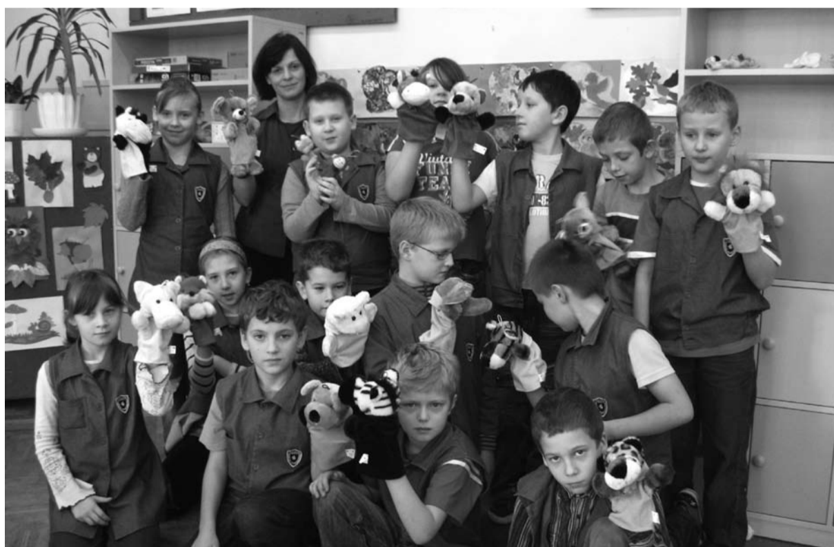
Zajęcia dydaktyczno-wyrównawcze w klasach I-III, SP 4”

Szkoła Podstawowa nr 4 w ramach zajęć tzw. unijnych obok zajęć dydaktyczno – wyrównawczych oraz wsparcia psychologicznego – pedagogicznego organizowanego również w innych szkołach, dla swoich uczniów prowadzi zajęcia artystyczne i teatralne na których młodzi adepci sztuki teatralnej uczą się jak występować przed publicznością i nie mieć tremy, w jaki sposób ze sobą współpracować, wyrażać emocje.