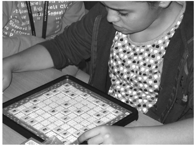
Kółko matematyczne w SP 1

W szkole działają dwie grupy teatralne, koło „Kuchnia artystyczna Gimnazjum nr 3” przygotowało spektakl teatralny „Aniołów dyskretny lot” oraz przygotowuje kolejny, wg Sławomira Mrożka „Na pełnym morzu”. Dodatkowo II zespół teatralny przygotował sztukę o życiu współ-