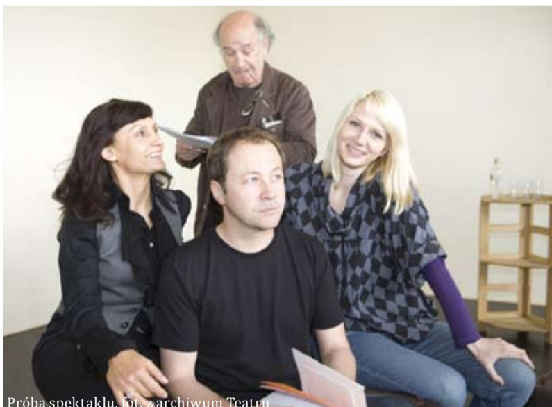
Próba spektaklu